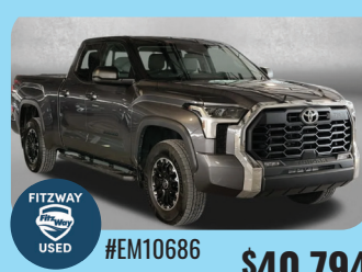
2023 TOYOTA TUNDRA 4X4 SR5 PRE-OWNED