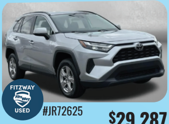
2024 TOYOTA RAV4 XLE PRE-OWNED