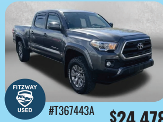
2017 TOYOTA TACOMA SR5 V6 - PRE-OWNED