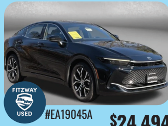
2023 TOYOTA CROWN XLE PRE-OWNED