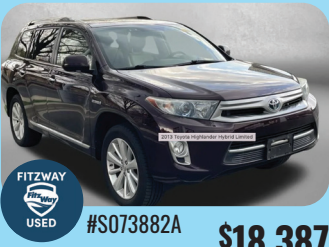
2013 TOYOTA HIGHLANDER HYBRID - PRE-OWNED