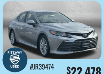
2023 TOYOTA CAMRY LE PRE-OWNED