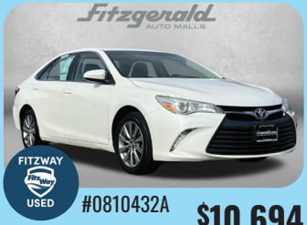
2015 TOYOTA CAMRY XLE PRE-OWNED