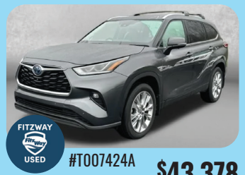
2023 TOYOTA HIGHLANDER HYBRID LIMITED - PRE-OWNED