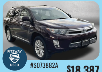
2013 TOYOTA HIGHLANDER HYBRID LIMITED - PRE-OWNED