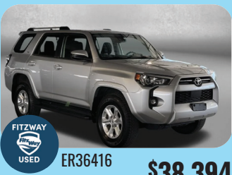
2024 TOYOTA 4RUNNER SR5 PRE-OWNED