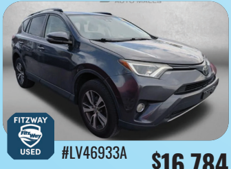
2017 TOYOTA RAV4 XLE PRE-OWNED