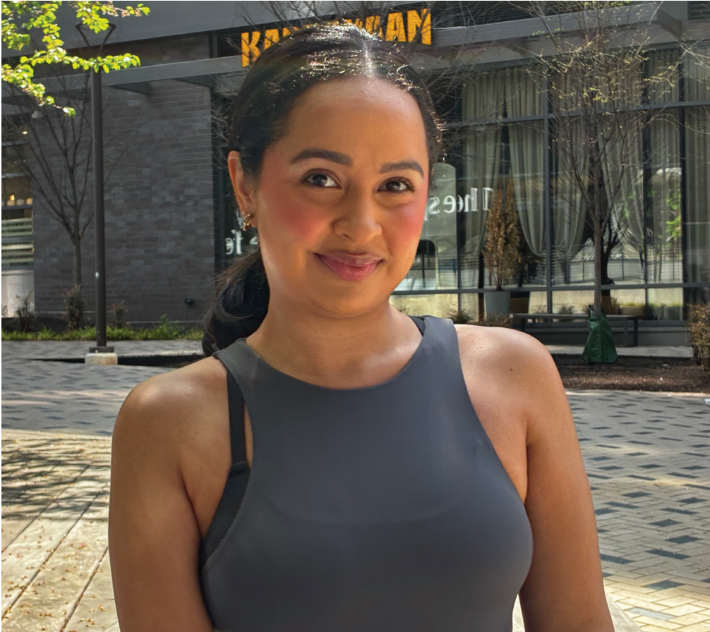
EL TIEMPO LATINO

school, incluyendo apoyo económico para la universidad