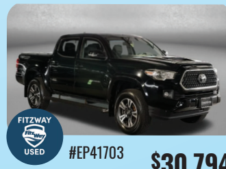
2018 TOYOTA TACOMA TRD SPORT V6 - PRE-OWNED