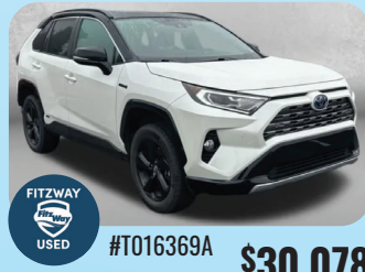
2021 TOYOTA RAV4 HYBRID XSE- PRE-OWNED