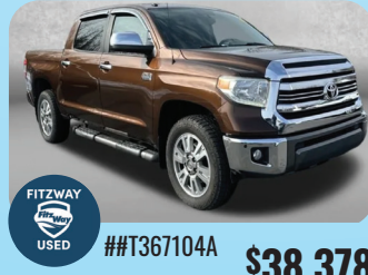
2017 TOYOTA TUNDRA 4X4 CREW MAX - PRE-OWNED