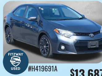
2016 TOYOTA COROLLA S PRE-OWNED