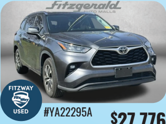
2020 TOYOTA HIGHLANDER XLE PRE-OWNED