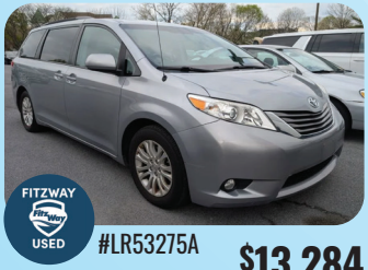
2014 TOYOTA SIENNA XLE PRE-OWNED

¡CIENTOS DE CARROS USADOS Y CERTIFICADOS con bajo millaje y los mejores precios!