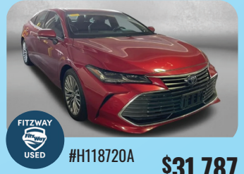
2022 TOYOTA AVALON HYBRID LIMITED - PRE-OWNED