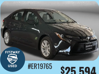
2026 TOYOTA COROLLA LE PRE-OWNED