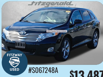
2012 TOYOTA VENZA LIMITED PRE-OWNED