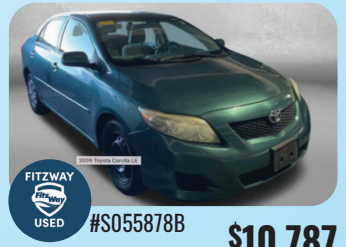
2009 TOYOTA COROLLA LE PRE-OWNED