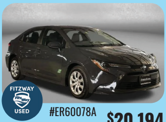
2024 TOYOTA COROLLA LE PRE-OWNED