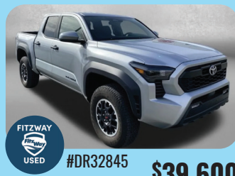
2025 TOYOTA TACOMA TRD OFF-ROAD - PRE-OWNED