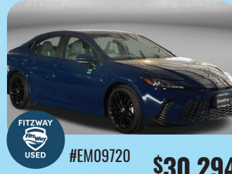
2025 TOYOTA CAMRY SE PRE-OWNED