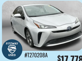
2019 TOYOTA PRIUS LIMITED PRE-OWNED