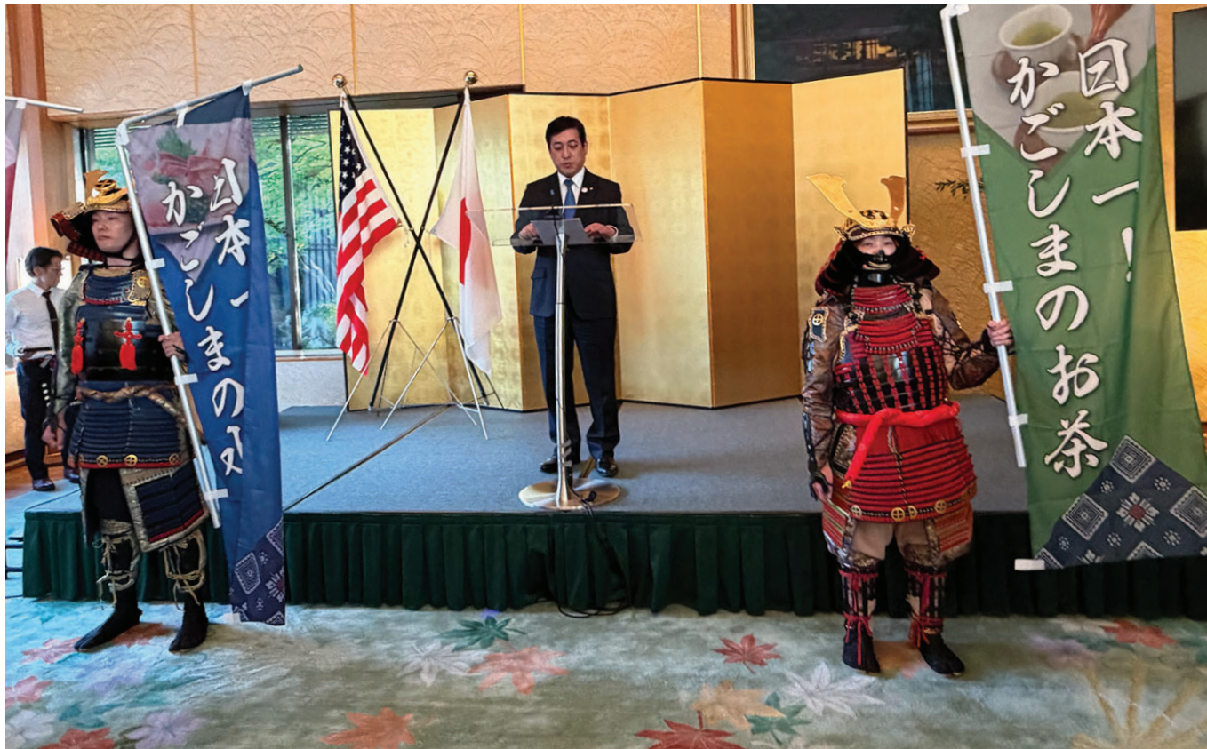
El gobernador de Kagoshima, Koichi Shiota, dando la bienvenida a los invitados a la recepción en Washington, DC.

Durante la recepción en Washington, esa fortaleza quedó clara. La prefectura promocionó productos de alta gama que incluyen carne wagyu reconocida por su marmoleo y textura, distintos estilos de shochu —la bebida