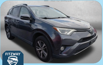
2017 TOYOTA RAV4 XLE PRE-OWNED