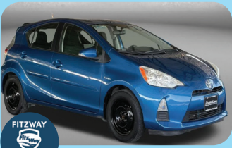
2012 TOYOTA PRIUS C TWO PRE-OWNED