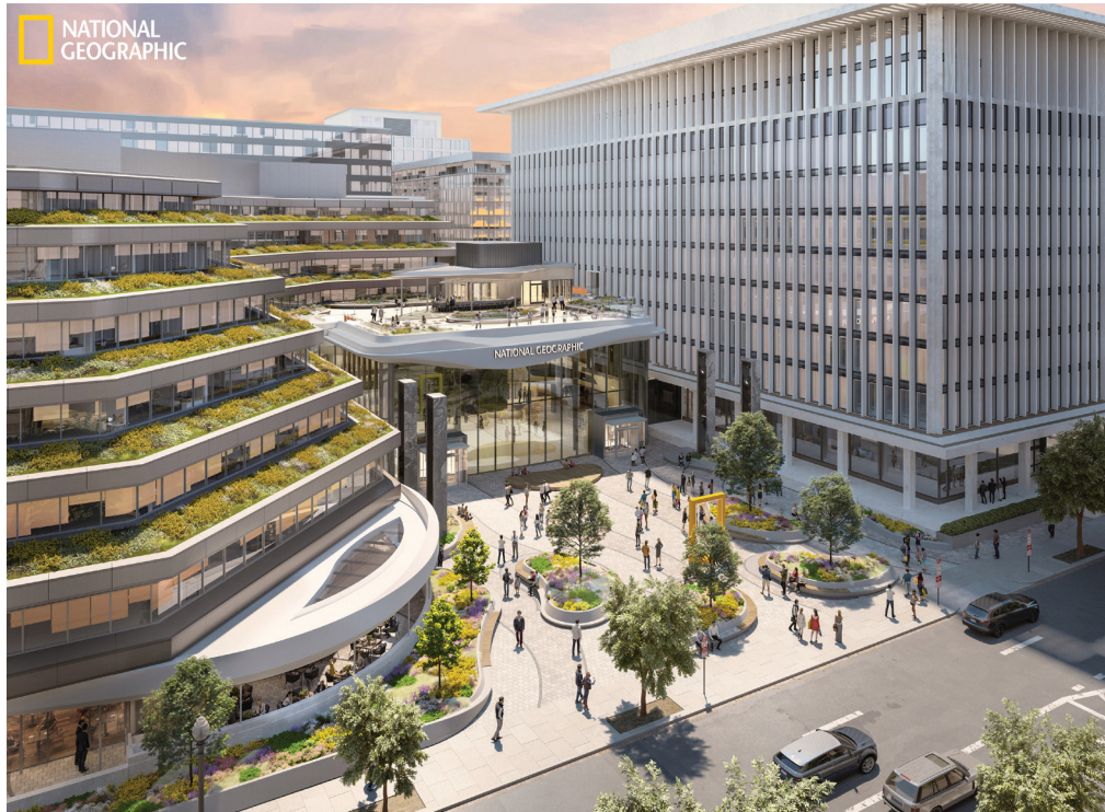
VISUALIZACIONES DE REDOVERTEX, BASADAS EN DISEÑOS DE HICKOK COLE ARCHITECTS, INC.