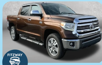
2017 TOYOTA TUNDRA 4X4 CREW MAX - PRE-OWNED