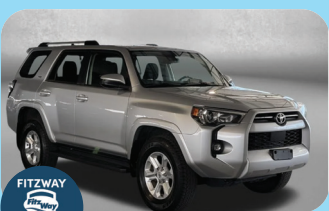
2024 TOYOTA 4RUNNER SR5 PRE-OWNED