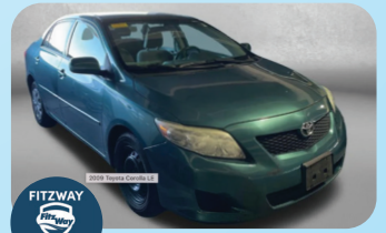
2009 TOYOTA COROLLA LE PRE-OWNED