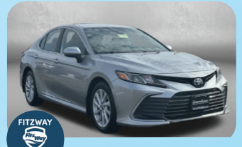
2023 TOYOTA CAMRY LE PRE-OWNED