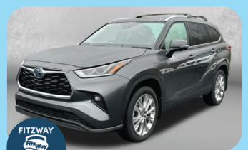
2023 TOYOTA HIGHLANDER HYBRID LIMITED - PRE-OWNED