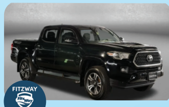
2018 TOYOTA TACOMA TRD SPORT V6 - PRE-OWNED