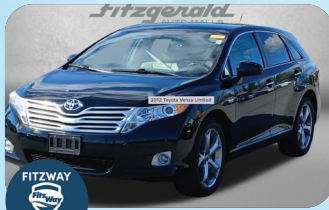
2012 TOYOTA VENZA LIMITED PRE-OWNED