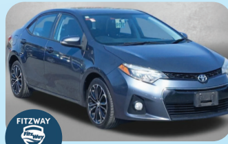
2016 TOYOTA COROLLA S PRE-OWNED