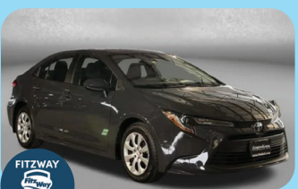
2024 TOYOTA COROLLA LE PRE-OWNED