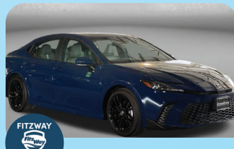
2025 TOYOTA CAMRY SE PRE-OWNED