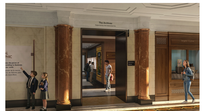
REPRESENTACIÓN ARTÍSTICA DE LOS ARCHIVOS EN EL MUSEUM OF EXPLORATION, QUE ABRIRÁ EN 2026.

NATIONAL GEOGRAPHIC MUSEUM OF EXPLORATION