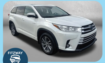
2018 TOYOTA HIGHLANDER HYBRID LIMITED - PRE-OWNED