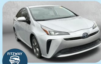
2019 TOYOTA PRIUS LIMITED PRE-OWNED