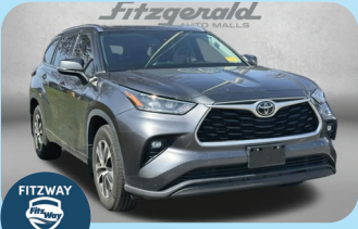
2020 TOYOTA HIGHLANDER XLE PRE-OWNED