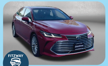
2022 TOYOTA AVALON HYBRID LIMITED - PRE-OWNED