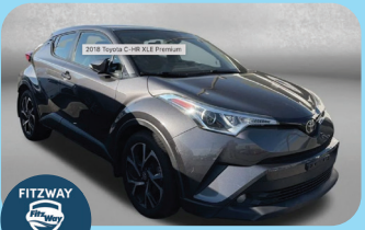
2018 TOYOTA C-HR XLE PREMIUM - PRE-OWNED