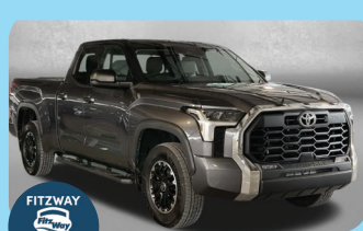
2023 TOYOTA TUNDRA 4X4 SR5 PRE-OWNED