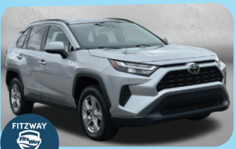
2024 TOYOTA RAV4 XLE PRE-OWNED