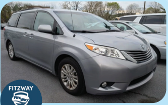
2014 TOYOTA SIENNA XLE PRE-OWNED

¡CIENTOS DE CARROS USADOS Y CERTIFICADOS con bajo millaje y los mejores precios!