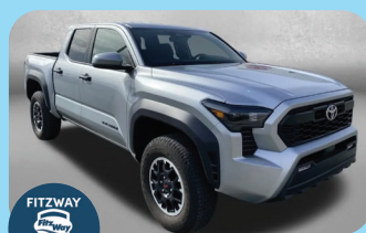
2025 TOYOTA TACOMA TRD OFF-ROAD - PRE-OWNED