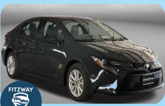
2026 TOYOTA COROLLA LE PRE-OWNED