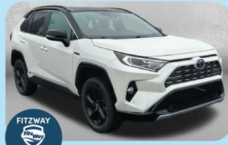
2021 TOYOTA RAV4 HYBRID XSE - PRE-OWNED