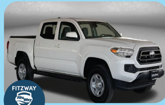
2023 TOYOTA TACOMA SR V6 PRE-OWNED