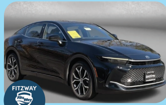
2023 TOYOTA CROWN XLE PRE-OWNED