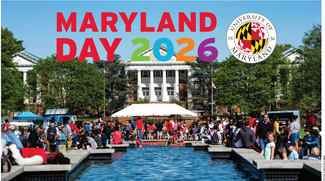
El campus de University of Maryland abre sus puertas el 25 de abril para Maryland Day 2026.

- Chalk Talk (Tawes Plaza, 10:00-13:00) – El Departamento de Inglés invita a escribir tus citas favoritas en el suelo de la plaza con tiza. Al mediodía, Tawes Plaza se convierte